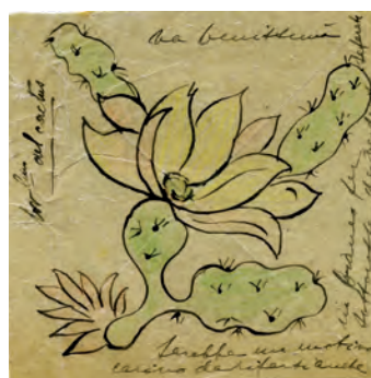
Disegno e ricamo Cactus (con appunti sul margine: "Tovagliolino del cactus - Va benissimo. Sarebbe un motivo carino da rifare anche in bianco per sottocoppe da vendere separate)

La Sicilia competeva a Venezia il primato nell'arte del ricamo bianco e del merletto, erano rinomate le "spingolate", e cioè dei merletti eseguiti coi fuselli oppure al tombolo, su tela sfilata, su tessuti a fondo rosso, di carattere arabo. La scelta dei decori da ricamare sui tessuti era compiuta attraverso lo studio di modelli per i disegni ricavati dall'osservazione di oggetti, di antichi disegni di stoffe, di motivi decorativi presenti nei palazzi o nelle chiese, da una interconnessione tra le arti e gli oggetti, che agivano come "media" del periodo, veicolando forme, decori, segni. La storia dell'arte del meridione, e in modo notevole della Sicilia, è caratterizzata da una vasta presenza dell'artigianato artistico. Le radici