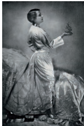
Nella pagina precedente Conclusioni della presentazione di Gabriele D'Annunzio nel catalogo della mostra Fiamma del Sud, 1928