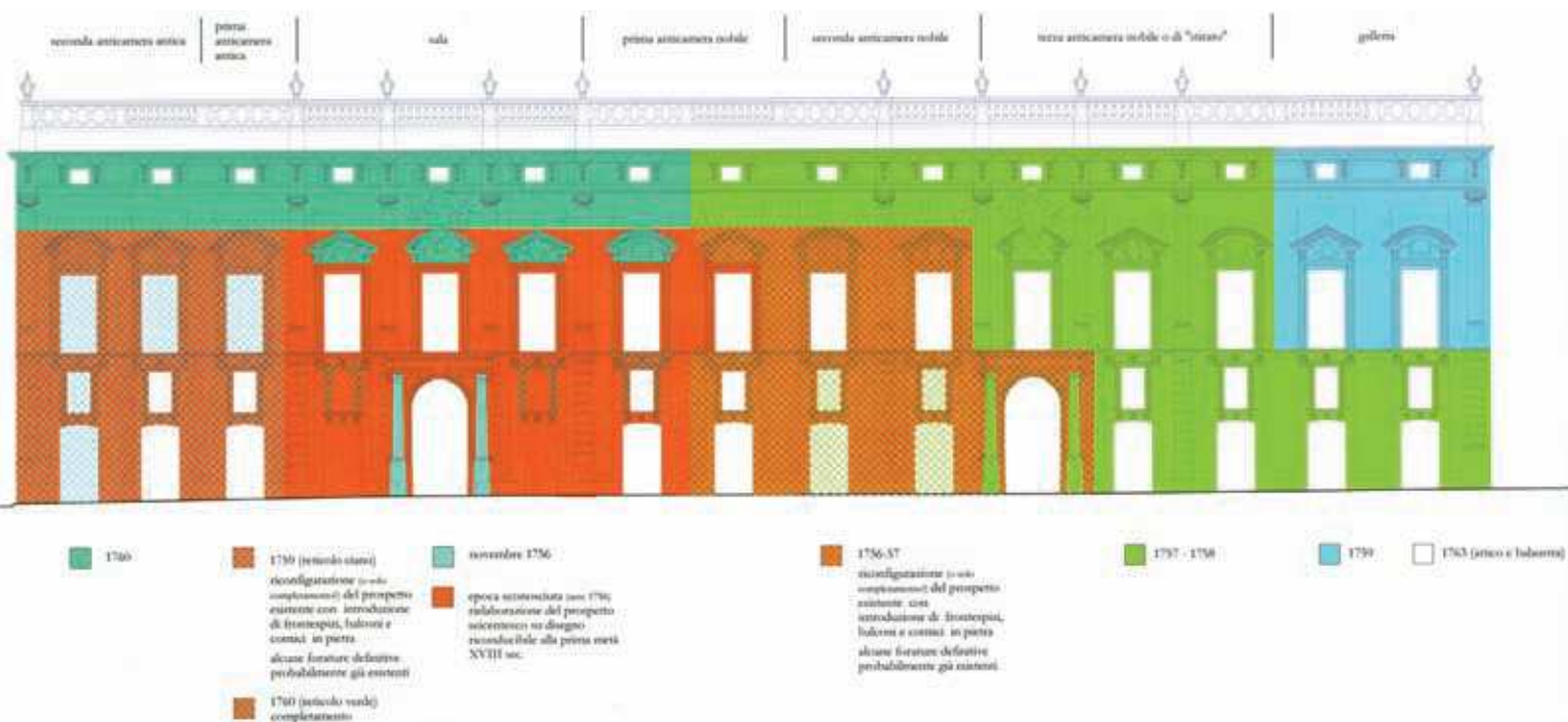
Schema cronologico delle fasi murarie del prospetto principale (P. Mattina, 2014)

13 - E. Kieven, Ferdinando Fuga e l'architettura romana del settecento , Roma, 1988; B. Azzaro, L'arte di "maneggiar fabbriche" in un cantiere del Settecento. La presenza di Sardi e Fuga , in «Palladio», n.s., X (1996), 17, pp. 51-63; B. Gravagnuolo, Per una reinterpretazione dell'opera di Ferdinando Fuga , in A. Gambardella (a cura di), Ferdinando Fuga, 1699 - 1999 , Roma, Napoli, Palermo, Napoli 2001, pp. 35-40